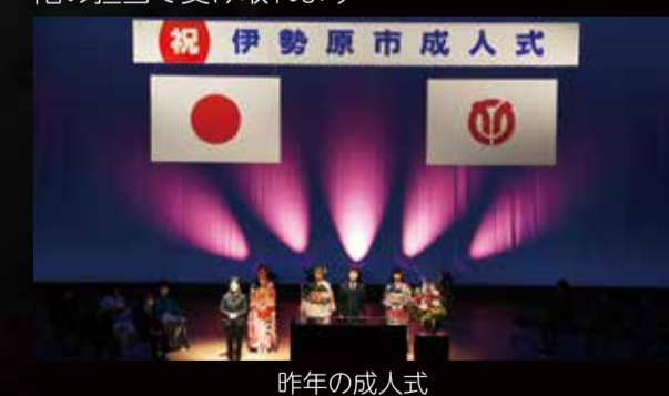
祝 伊勢原市成人式 昨年の成人式

◇当日出席できない人は、1月31日(火)まで案内状と引き換えに恩師メッセージブックを市役所5階の担当で受け取れます