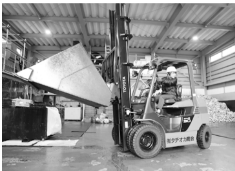
工場内でフォークリフトを運転する文屋さん