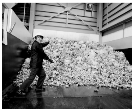
1日あたり約2トンの空き缶が集まっています