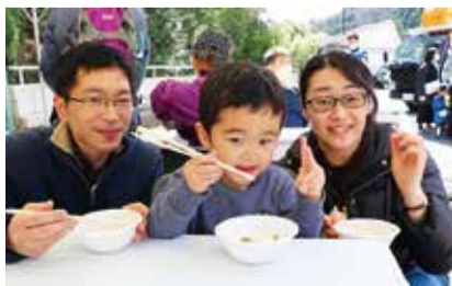
のどごしが良い豆腐に思わず笑顔

参加者の一人は「特産品を再認識する良い機会。豊かな自然に囲まれているため、きれいな空気も相まって食べやすく感じた。いろいろなお店を食べ歩き、地元の味を堪能したい」と話しました。