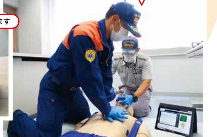
人形と連動したタブレットを見ながら胸骨圧迫