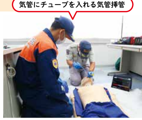
気管にチューブを入れる気管挿管

消防・救急隊員による、交通事故が発生し、傷病者の搬送を想定した訓練を実施しました。