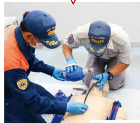
専用の器具で酸素を送ります