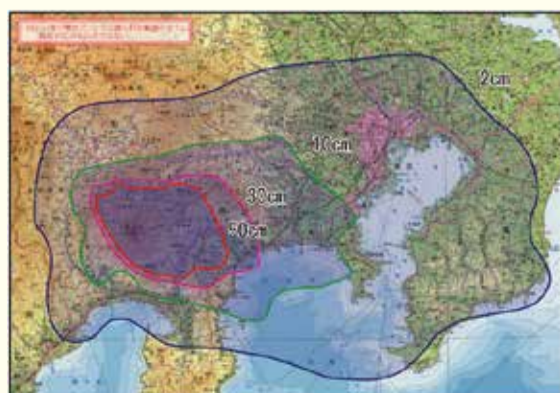
富士山の噴火による火山灰被害予想図

地殻変動の活発化に伴い、火山災害も懸念されています。国内には111の活火山があり、このう