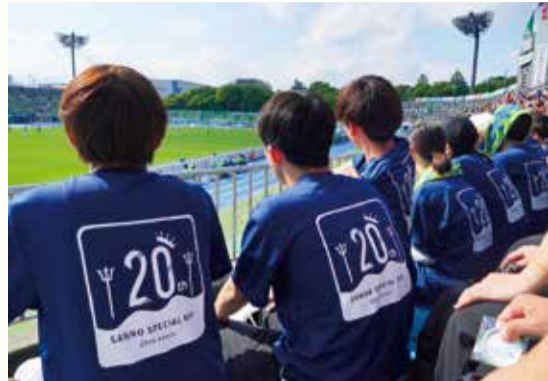
有観客となり観戦できるようになったサッカーの試合

包括協定を結んでいる産業能率大学の協力のもと、学生の視点から、さまざまなことをレポートします