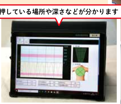
押している場所や深さなどが分かります

自動心臓マッサージシステム(ルーカス3) 現在、全救急車に自動心臓マッサージシステムを導入しています。 この機器は心肺停止となった傷病者に対して、最も重要である「絶え間ない胸骨圧迫」を一定のリズムと強さで行うことができます。狭い場所や長距離搬送など、胸骨圧迫の中断を余儀なくされるケースでも有効であり、救命率の向上が期待できます。