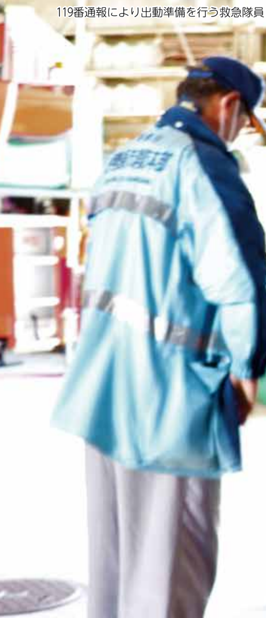
119番通報により出動準備を行う救急隊員

厚生労働省と総務省消防庁は、毎年9月9日を「救急の日」と定め、全国で救急に関わるさまざまな取り組みが行われています。