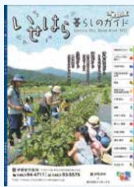
いせはら暮らしのガイド2020