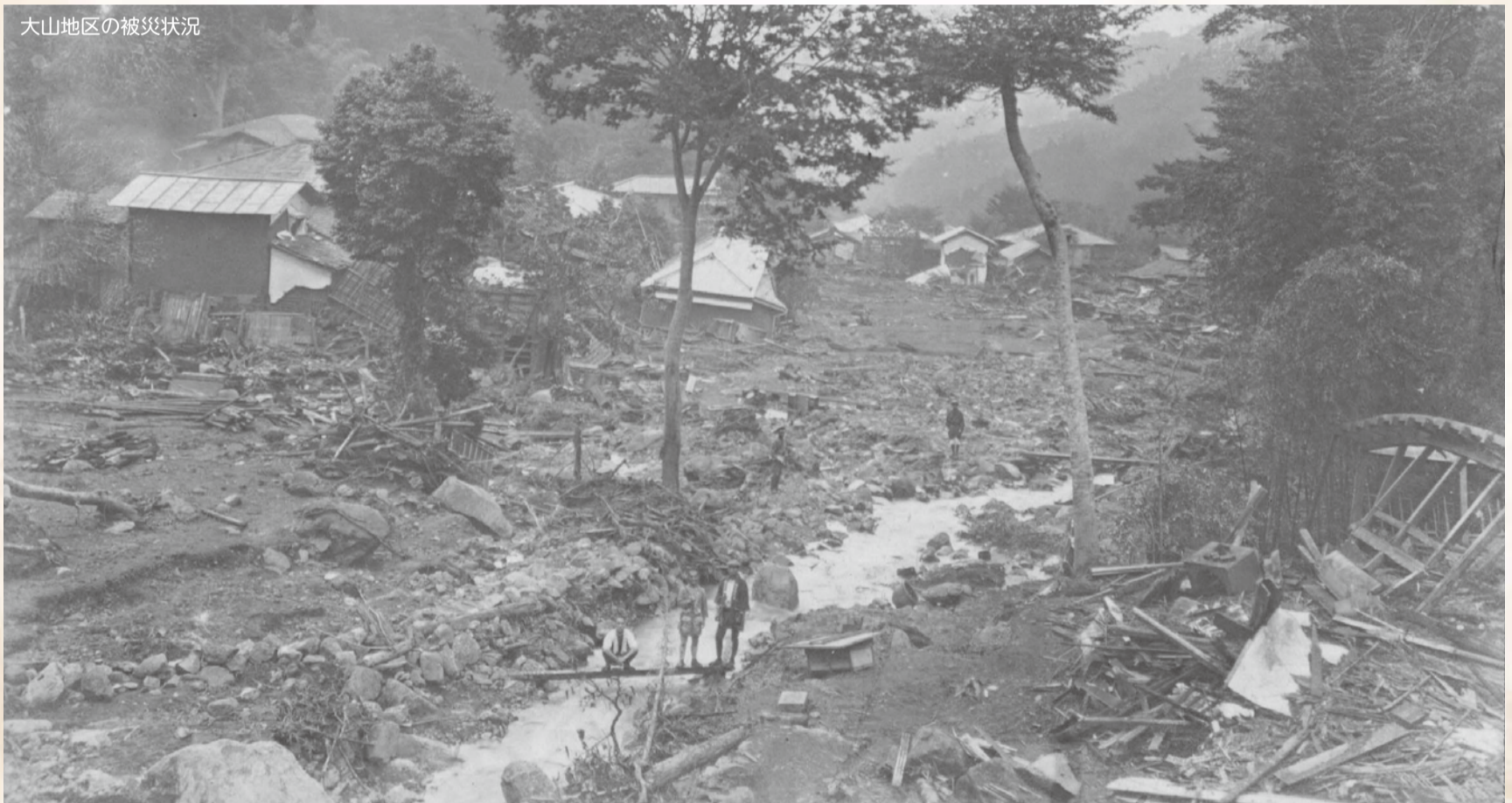
大山地区の被災状況

関東一円に壊滅的な被害を与えた関東大震災は、本市にも甚大な被害をもたらしました。現在の伊勢原市域を構成する、当時の2町5村で、128人の尊い命が失われ、全壊・半壊合わせて、約2500戸(全壊率約48%)の家屋被害を受けました。人的・家屋被害ともに大田村が最も多く、大山町、高部屋村では全壊率は低いものの、土砂災害による被害が発生しました。