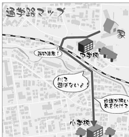
オリジナルの地図を作成できます