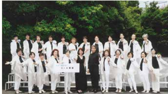
第45回全日本おokaあさんコーラス関東支部大会の集合写真(2022年)