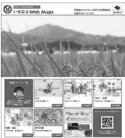
防災や子育て情報などがご覧になれます