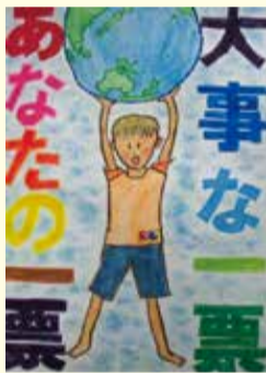
令和5年度優秀作品