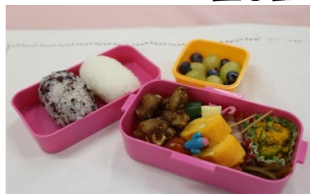
※④～⑥は裏面をご覧ください。