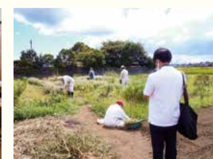
農業を行う事業所もありました