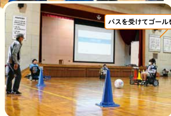
パスを受けてゴールを狙います