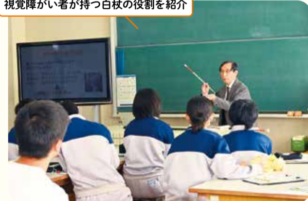
視覚障がい者が持つ白杖の役割を紹介

身体障がい者に、障がいの特性や生活上での困り事などを話していただきました。また、フットガードを取り付けた電動車椅子で行う「電動車椅子サッカー」や、目隠し歩行などのバリアフリー体験も行いました。