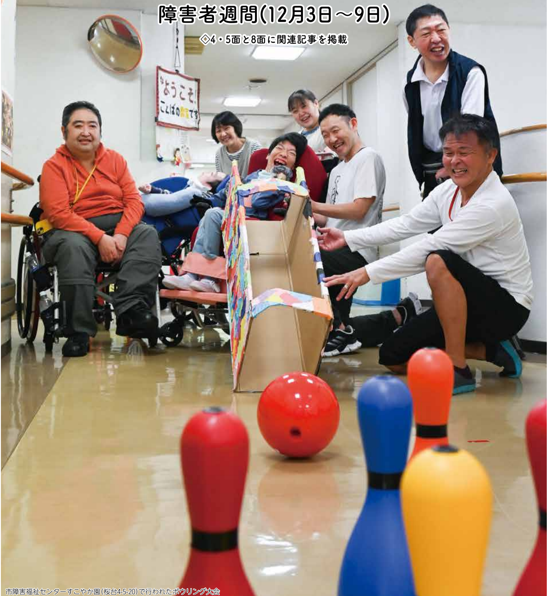
市障害福祉センターすこやか園(桜台4-5-20)で行われたボウリング大会