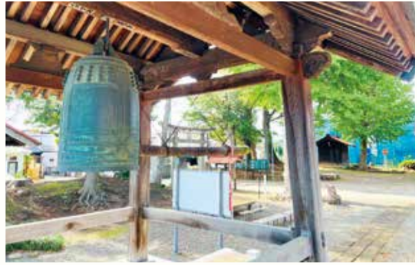
高部屋神社にある銅鐘

人も世も忙しくなる師走。気付けば大みそかを迎え、除夜の鐘を聞きながら気持ち新たに迎えるのだらう。さて、鐘といえば寺である。伊勢原市民歴がまだ浅い私が、市内を散策していて不思議に感じた事がある。寺のアイテムを連想する鐘が神社にある。それも1カ所や2カ所だけではない。なぜだろう。神社と寺の関係を探る