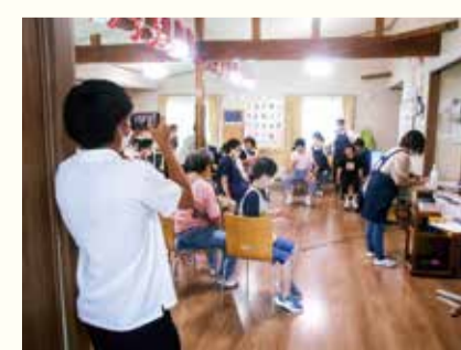
普段過ごしている施設の様子を紹介