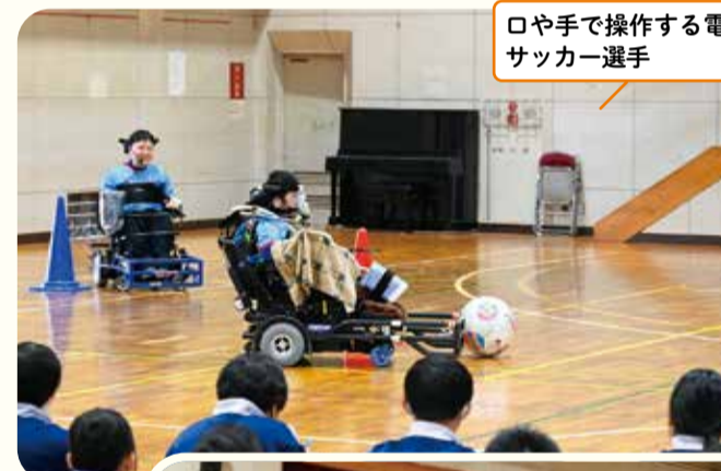
口や手で操作する電動車椅子サッカー選手