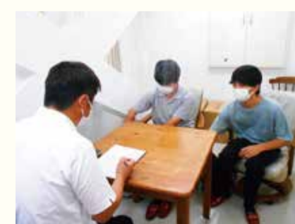
話を聞いて動画のコンセプトを固めます