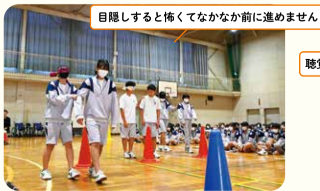
目隠しすると怖くてなかなか前に進めません