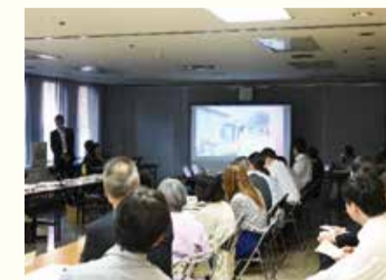
動画発表会の様子

作成した動画は、自宅でも事業所の様子が分かる大変好評で、今年度も施設の紹介動画を作成・公開しています。