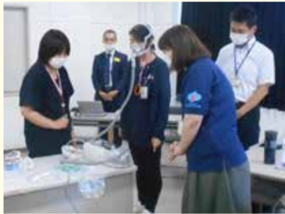
9月1日に行われた研修会

また、研修会の企画なども行っています。先日は伊勢原市障がい者くらしを考える協議会医療的ケア等支援部会において、相談員や訪問看護師、サービス提供事業所、行政機関などに向けて、在宅酸素療法や人工呼吸器の研修会を行いました。支援者の中には、医療機器を目にする機会があっても、実際に扱ったり装着したりすることがない人も多いため、貴重な体験となりました。