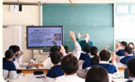
聴覚障がい者の質問に挙手で答える生徒