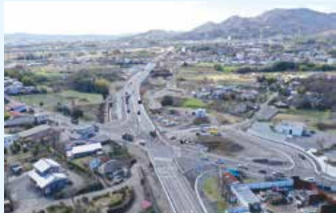
分れ道交差点◇2月26日撮影

県道603号(西富岡バイパス)は、「新東名高速道路」および事業中の「厚木秦野道路」へアクセスする道路で全整備区間1.9kmのうち、日向薬師入口交差点から分れ道交差点までの約0.7kmが3月25日に開通し、全線での利用が開始されました。