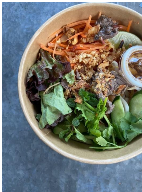
ブンボーナンボー

ブンボーナンボー：ベトナムの米麺の混ぜ麺。魚醤とライムでさっぱりいただけます。 日替わり弁当：お魚を使ったヘルシーなお弁当。南国の味と香りをお楽しみください。