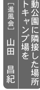
総合運動公園に隣接した場所にオートキャンプ場を 「進風会」山田 昌紀