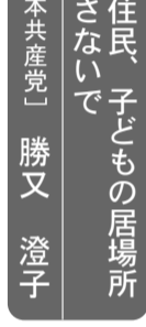
地域の住民、子どもの居場所をなくさないで 「日本共産党」勝又 澄子