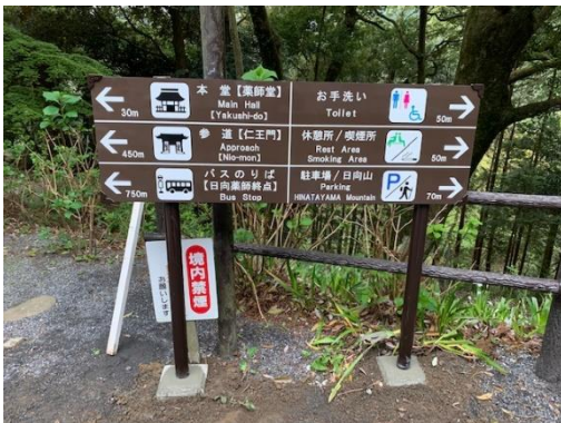
案内サインの設置（日向薬師）