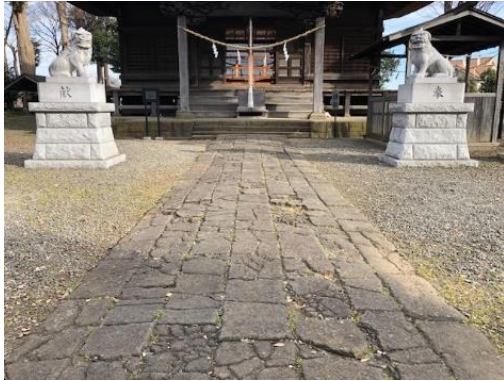
施工前の参道（高部屋神社）