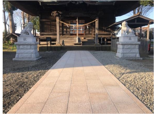
施工後の参道（高部屋神社）