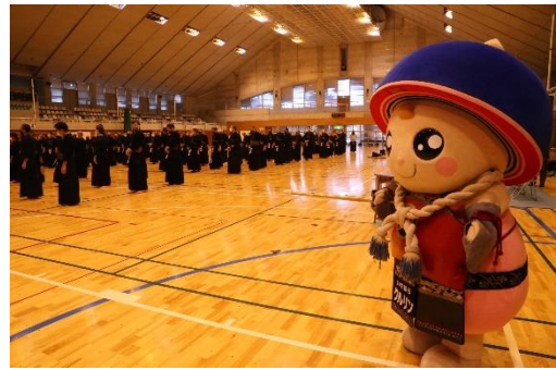
前回「かながわシニアスポーツフェスタ剣道大会」の様子