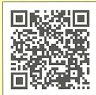
LINE Pay 請求書支払い