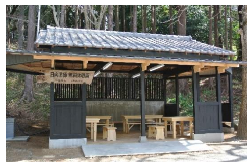
休憩施設の修繕（日向薬師）