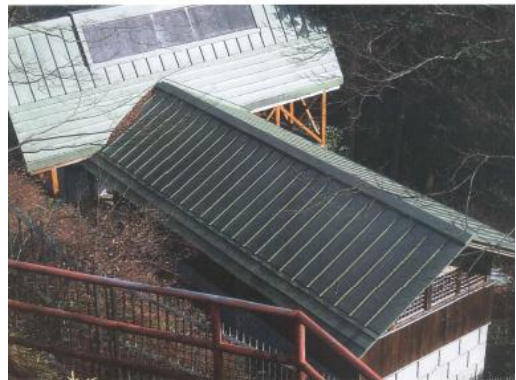
公衆トイレの改修（大山阿夫利神社）