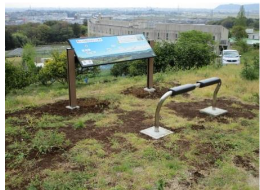
元宮の眺望板（比々多神社）