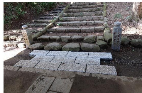
参道の整備（日向薬師）